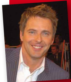
Jörg Pilawa, Fernsehmoderator