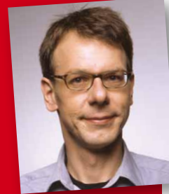
Markus Kurth, Mitglied des Deutschen Bundestages, Bündnis90/ Grüne