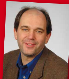
Ottmar Miles-Paul, Landesbehindertenbeauf- tragter Rheinland-Pfalz