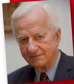
Richard von Weizsäcker, Bundespräsident a.D.