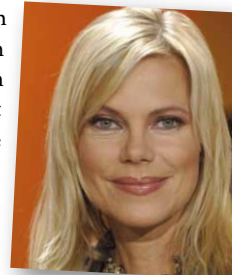
Nina Ruge, Autorin/Moderatorin

Leben – das heißt für mich: Lernen, eine Ausbildung machen, sich im Beruf verwirklichen, sich bewähren – und natürlich Familie haben und ein Zuhause. Die Vorstellung, dass Menschen mit Behinderung all das verwehrt sein sollte, weil sie kaserniert sind im Heim – ist mir unerträglich. Einige gute Angebote gibt es schon. Wir brauchen mehr davon. Und einen Wandel in den Köpfen all derer, die das Thema NICHT betrifft. Stellen Sie sich vor, Sie würden plötzlich kaserniert. Ihr erster Gedanke: „Daheim statt Heim“! Bitte fördern auch Sie diese Initiative.