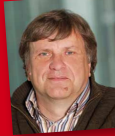
Dr. Ilja Seifert, Mitglied des Deutschen Bundestages, Die Linke