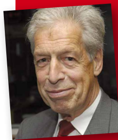
Henning Scherf, Bürgermeister der Stadt Bremen a.D.

Selbstbestimmt leben in kleinen Wohneinheiten bei guter Unterstützung und Versorgung. Das möchte das Evangelische Johanneswerk erreichen. Gemeinsam mit Menschen mit Behinderung entwickeln wir in Nordrhein-Westfalen komplett neue differenzierte Angebote in gemeindenahen Wohnverbänden. Mit dieser Auswahl an Wohnangeboten werden individuelle und selbst gewählte Lösungen für zirka 1000 Menschen mit Behinderungen ermöglicht und die soziale Integration und Teilhabe am gesellschaftlichen Leben unterstützt.