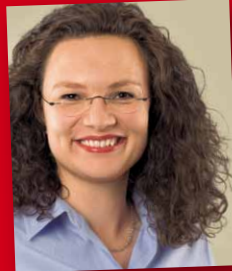
Andrea Nahles, Mitglied des Deutschen Bundestages, SPD