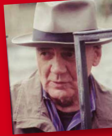
Bruno Ganz, international tätiger Schweizer Schauspieler